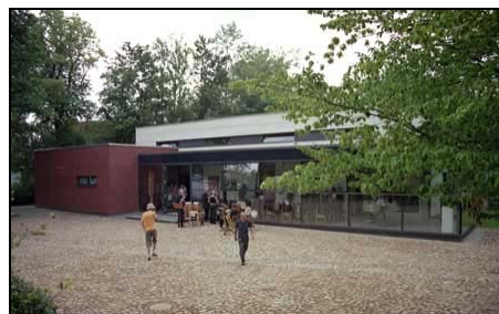
Atelierhaus der Sparkassen-Kulturstiftung in Trittau

Die Sparkassen-Kulturstiftung Stormarn hat am 8. Juli 2006 ihr neu errichtetes Atelierhaus in unmittelbarer Nachbarschaft zum Kulturzentrum Wassermühle der Gemeinde Trittau eröffnet. In der idyllisch gelegenen Wassermühle hat die Stiftung bereits seit 1992 eine Wohnung angemietet, die jeweils für ein Jahr im Rahmen eines Wohn- und Arbeitsstipendiums an Künstlerinnen und Künstler vergeben wird. Zum Abschluss des Stipendiums findet seit dem eine Präsentation der aktuellen Arbeiten in den Ausstellungsräumen der Wassermühle statt. Darüber hinaus werden in Zusammenarbeit zwischen Gemeinde und Stiftung über das Jahr verteilt 6 bis 8 Ausstellungen zeitgenössischer Kunst gezeigt.