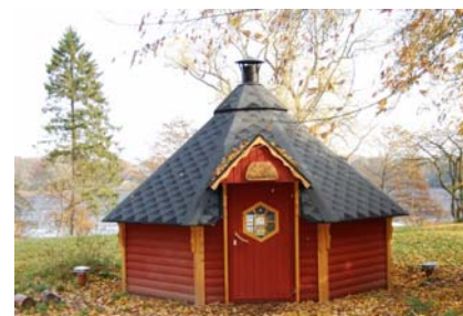
Kota „Kaninchenbau“ der Sparkassen-Stiftung

Die Sparkassen-Stiftung Stormarn hat dabei die Kosten für den Niedrigseilgarten übernommen und drei eigene Kotas sowie sechs Container zur Unterbringung von Spielfahrzeugen für die Kinder aus den Stormarner Kindergärten auf dem Gelände in Grabau errichtet.