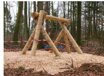
„Nestschaukel“ auf dem Waldspielplatz Grabau

Neu angelegt wurden im nicht frei zugänglichen Bereich im Jahr 2010 ein Grillplatz (mit Lehmbackofen), eine Kräuterspirale und ein Tümpel. Daneben wurde auf dem „Treckerparcours“ ein Spiel-Blockhaus errichtet, mit den Arbeiten für ein neues Klettergerät wurde begonnen, bedingt durch das Wetter (Frost und Schnee) konnten die Arbeiten aber im Jahr 2010 nicht mehr abgeschlossen werden.