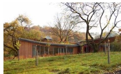
Seminargebäude der Sparkassen-Kulturstiftung

Es wurde in Holzrahmenbauweise erstellt und weitgehend auf Pfählen errichtet, um so nur einen möglichst kleinen Eingriff in den Boden bezogenen Lebensraum von Pflanzen und Tieren vorzunehmen.