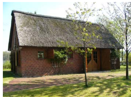
„Hütte am See“ der Sparkassen-Kulturstiftung in Grabau

Die Sparkasse Holstein hat daneben der Sparkassen-Kulturstiftung Stormarn im Jahr 2008 einen seinerzeit von der damaligen Kreissparkasse Stormarn aus finanziellen Gründen übernommenen Teil des Forstes (Försterei-grundstück, bebaut