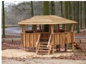
„Baumhaus“ auf dem Waldspielplatz Grabau

Das eigentliche Lehrpfadgelände - mit Niedrigseilgarten und Waldspielplatz - steht der Öffentlichkeit jederzeit frei zur Verfügung und wird von Anfang an stark von Familien mit Kindern für Besuche „auf eigene Faust“ genutzt.