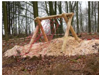
„Spinnennetz“ auf dem Waldspielplatz Grabau