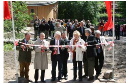
Eröffnung am 14.05.2009

Neben dem waldpädagogischen Angebot für die Stormarner Kindergärten und Grundschulen wurden in den Sommerferien 2009 auch für Stormarner Kinder erste Ferienangebote angeboten und von diesen zahlreich besucht.