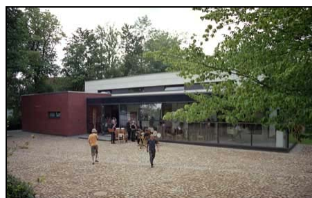
Atelierhaus der Sparkassen-Kulturstiftung in Trittau

Die Sparkassen-Kulturstiftung Stormarn hat am 8. Juli 2006 ihr neu errichtetes Atelierhaus in unmittelbarer Nachbarschaft zum Kulturzentrum Wassermühle der Gemeinde Trittau eröffnet. In der idyllisch gelegenen Wassermühle hat die Stiftung bereits seit 1992 eine Wohnung angemietet, die jeweils für ein Jahr im Rahmen eines Wohn- und Arbeitsstipendiums an Künstlerinnen und Künstler vergeben wird. Zum Abschluss des Stipendiums findet seit dem eine Präsentation der aktuellen Arbeiten in den Ausstellungsräumen der Wassermühle statt. Darüber hinaus werden in Zusammenarbeit zwischen Gemeinde und Stiftung über das Jahr verteilt 6 bis 8 Ausstellungen zeitgenössischer Kunst gezeigt.